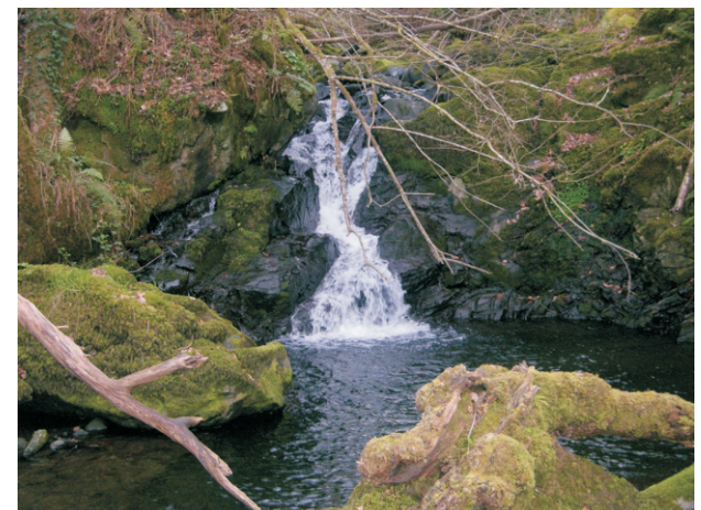
Ferveza do Forte