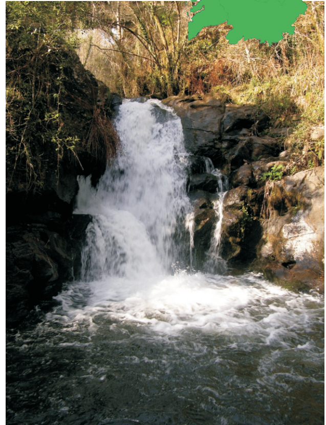
Ferveza do río das Mestas

COMO CHEGAR: séguese o camiño ata unha minicentral e desde alí río arriba.