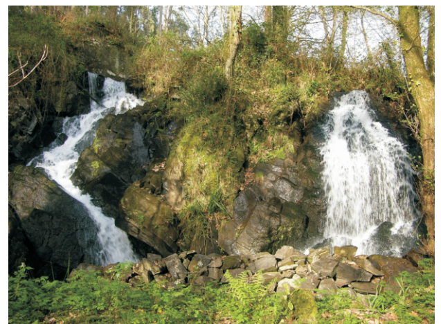
Ferveza de Carballeiro